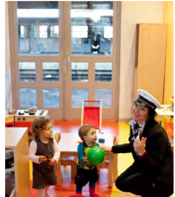
Crèche - Roanne