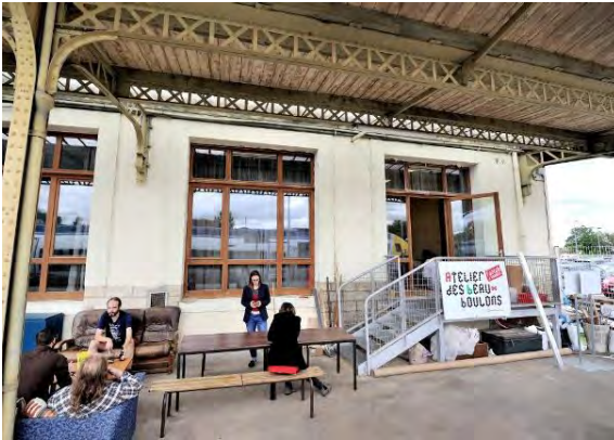
Tiers-lieux / coworking « Les Riverains » – Gare d'Auxerre