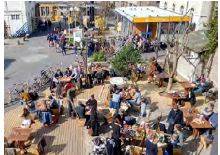
Les Grands Voisins : travailler, se divertir, se rencontrer, découvrir