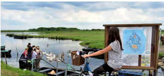
Saint Nazaire Agglomération : création d'itinéraires cyclables à la découverte de l'intérieur le long du fleuve Brivet depuis le port, en cours