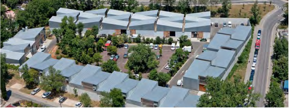
Des zones d'activités plus denses, adaptées au contexte urbain - La cité artisanale de Valbonne