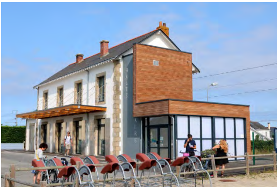
Halte solidaire - gare de Batz-sur-Mer