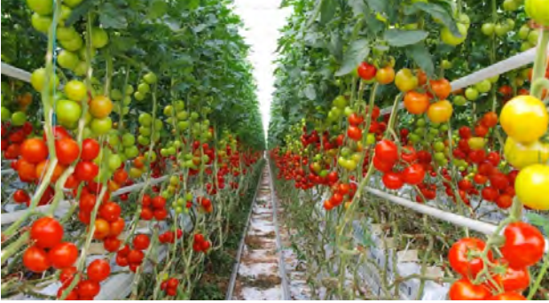
Tomates des Paysans de Rougeline produites grâce à la fermentation de déchets ultimes – Véolia (Gironde)