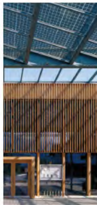
Toits photovoltaïques – Ludisch - Autriche Hermann Kaufman