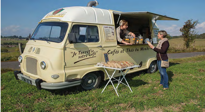
Food truck rural