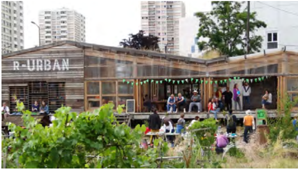
Agrocité – Colombes, micro ferme expérimentale, jardins communautaires, production d'énergie,...