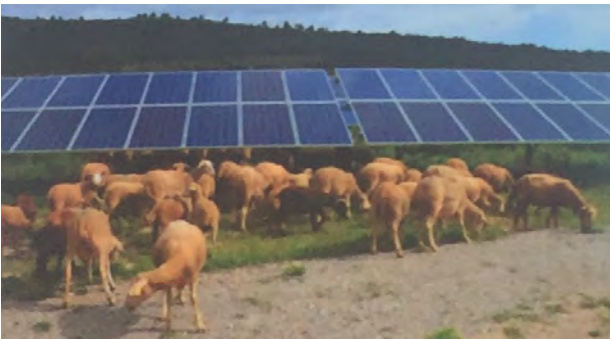
Co-usage des Corbières - pâturage et production d'énergie