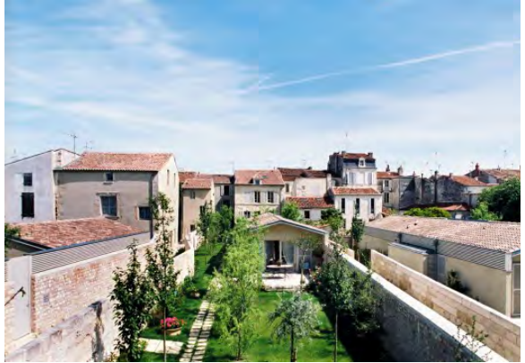
Le trame d'espaces verts à partir des jardins individuels