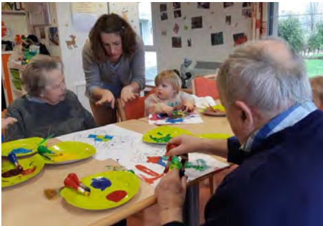
Des espaces de jeux pour les enfants dans les EPHAD - Rennes