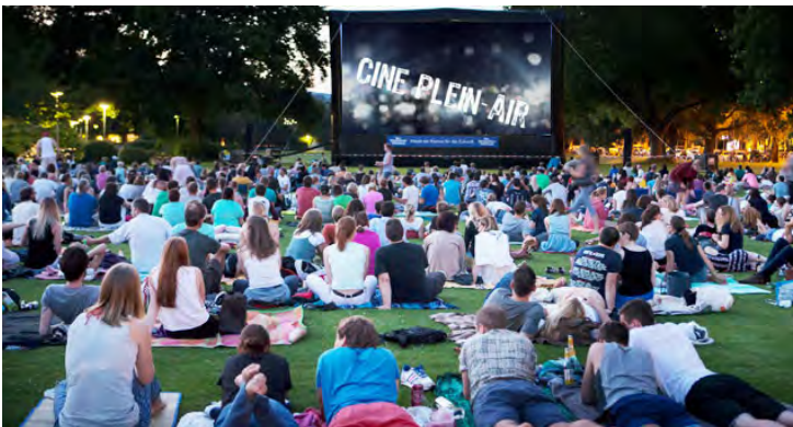
Le cinéma en plein air