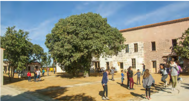
École « Domaine du possible » - Volpelière, ferme réhabilitée en école expérimentale