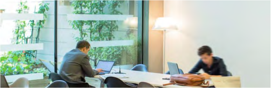
Les salons Grand Voyageur de la SNCF