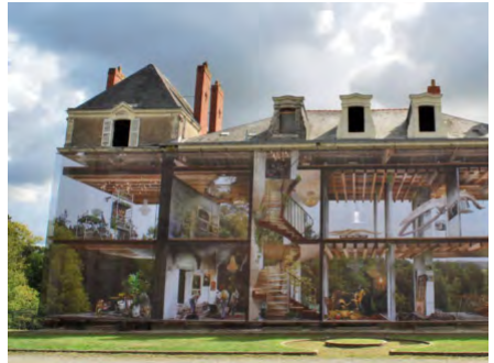
Le chantier participatif de Tréllières