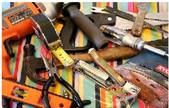
Plateformes de partage d'outils