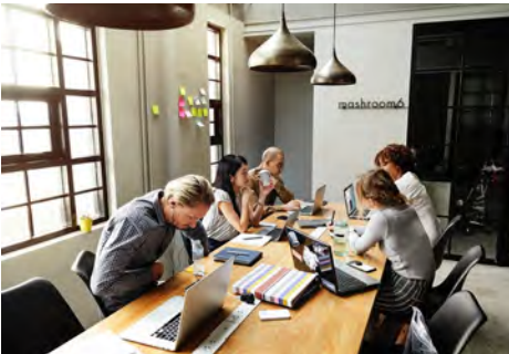
Le développement du coworking